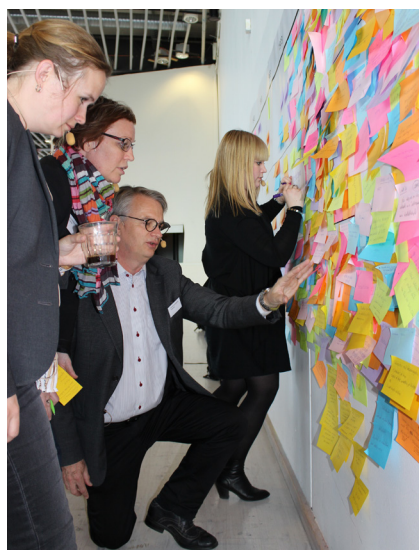
Workshop för att skapa samsyn kring problem/målbild och åtgärder.

Våra erfarenheter från Trafiksäkerhetsrevisionen kommer också väl till pass, liksom en bred och mångårig erfarenhet från trafiksäkerhetsarbete i tätorter, såväl utredande som praktiskt.